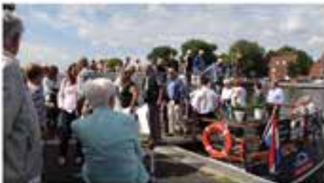
Foto: Jaarlijks Uitje Ymere - bewoners commissies

Nu de dagen weer korter worden en de avonden langer merken we bij De Waakvlam dat Ymere diverse grootonderhoudsprojecten gaat opstarten: de Bisschop Callierstraat en omgeving, het complex Zomervaart / Dirk Schäferstraat en Prins Bernhardlaan.